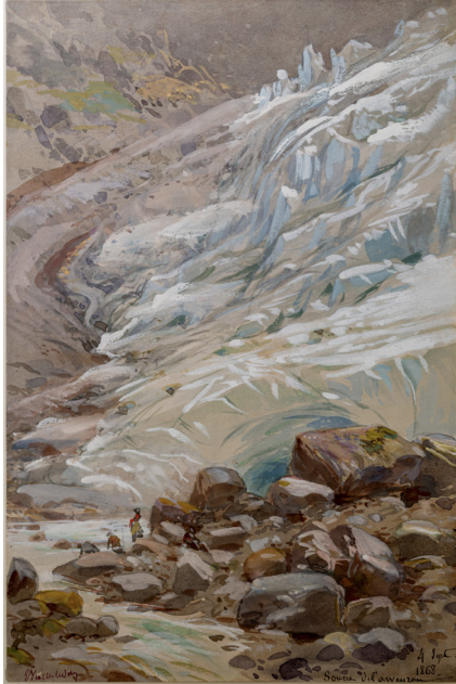
Viollet-le-Duc, La source de l'Arveyron , 1868 (aquarelle et gouache sur traits à la mine de plomb). Musée Lambinet, ville de Versailles © Musée Lambinet, ville de Versailles/Art Shooting.