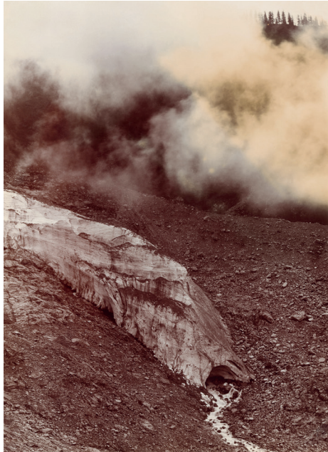
Haute-Savoie, Périmètre de l'Arve, Série de Chamonix[-Mont Blanc], glacier d'Argentière, Paul Mougin, 1904. Ministère de l'Agriculture, 20190124/2, Archives Nationales de France