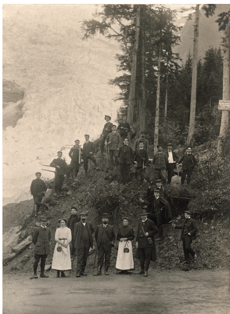
Haute-Savoie, Périmètre de l'Arve, Série de Chamonix-[Mont Blanc], École normale d'instituteurs de Bonneville aux Bossans [Bossons], Paul Mougin, 1910. Ministère de l'Agriculture, 20190124/2