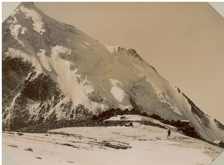
Haute-Savoie, Périmètre de l'Arve, Série de Saint-Gervais, glacier de Tête-Rousse, emplacement du trou supérieur, à rapprocher des n°671, 145, 166 et 1313, Paul Mougin, 1905. Ministère de l'Agriculture, 20190124/39