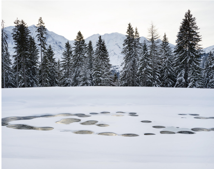
Bertrand Stoffleth, Recoller la montagne , 2020 III. Retenue collinaire, lac artificiel de nivoculture, domaine skiable de Saint-Gervais - France, janvier 2020