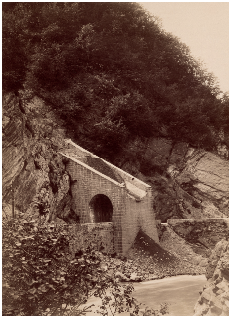
Haute-Savoie, Périmètre de la Dranse, Série d'Abondance , passage d'un torrent sur la route de Thonon à Bioge, Guerry, 1886. Ministère de l'Agriculture. 20190124/49, Archives Nationales de France © Archives Nationales de France