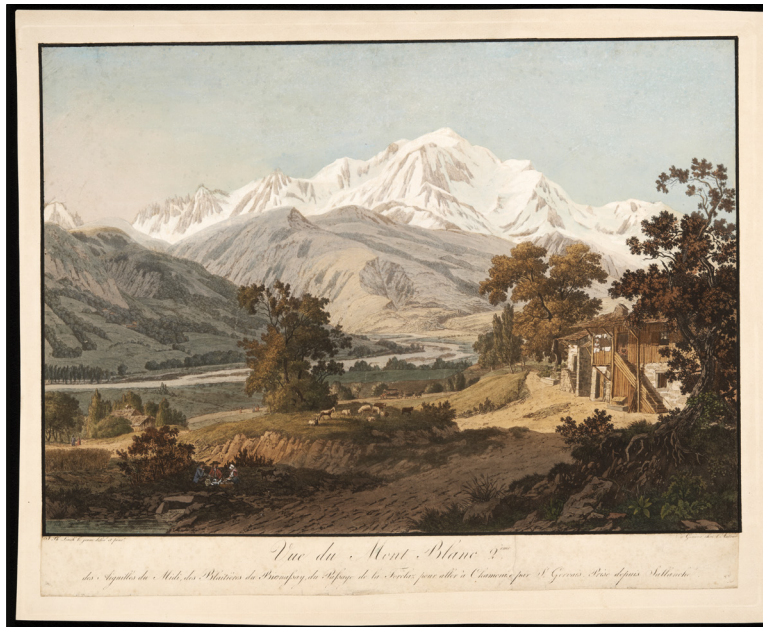
Linck, Jean-Philippe, Vue du Mont-Blanc , Gravure aquarellée et gouachée, 977-I-1-0081, Département de la Haute-Savoie/©Dep74