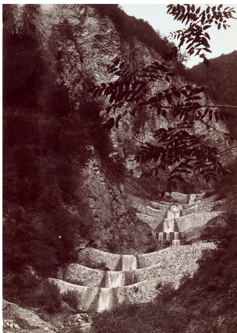
Savoie, Périmètre de la Haute-Isère, Série d'Ugines, torrent de Nant Trouble, le lit entre les barrages 3 2 et 4 4, Paul Mougin, 6 septembre 1901. Ministère de l'Agriculture, 20160113/22